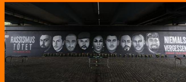
Porträts der Ermordeten des rechten Terroranschlags von Hanau

Bitte beachten Sie immer aktuelle Ankündigungen und Änderungen in der Presse und auf www.darmstadt.de oder kontaktieren Sie uns.